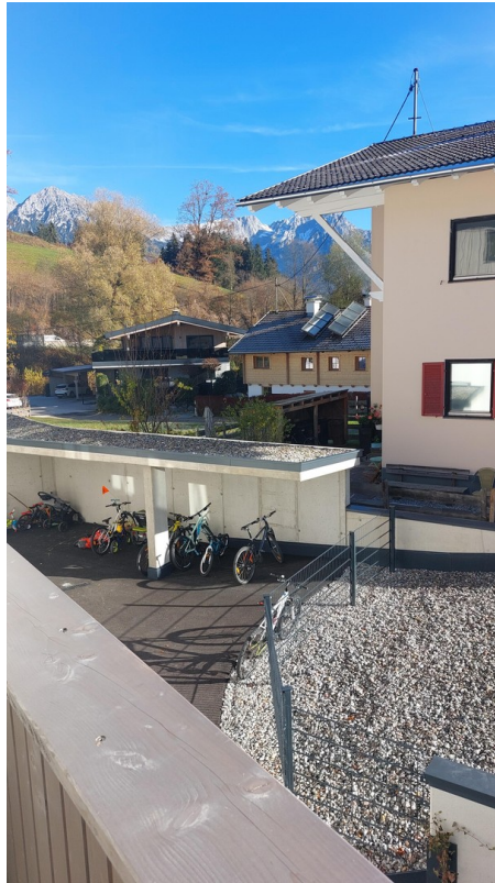
Blick zum Kaiser