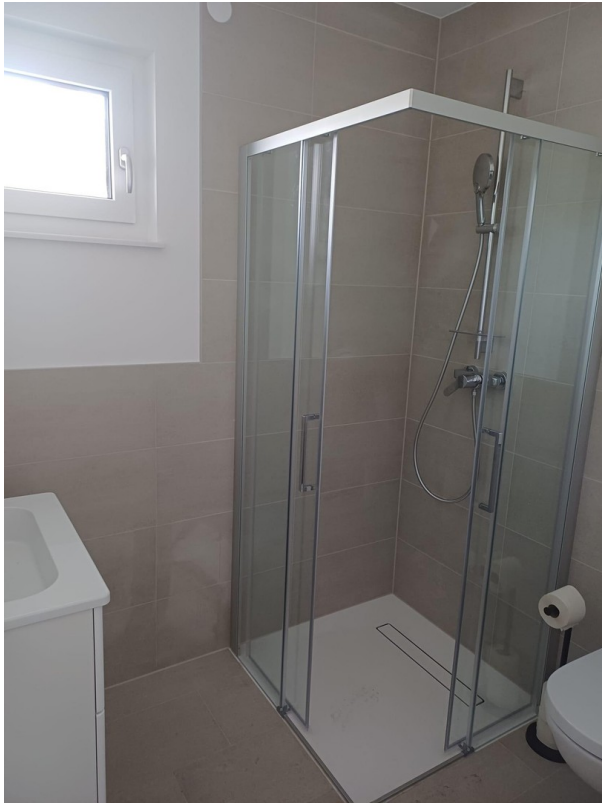
Bad 2 mit Duschkabine