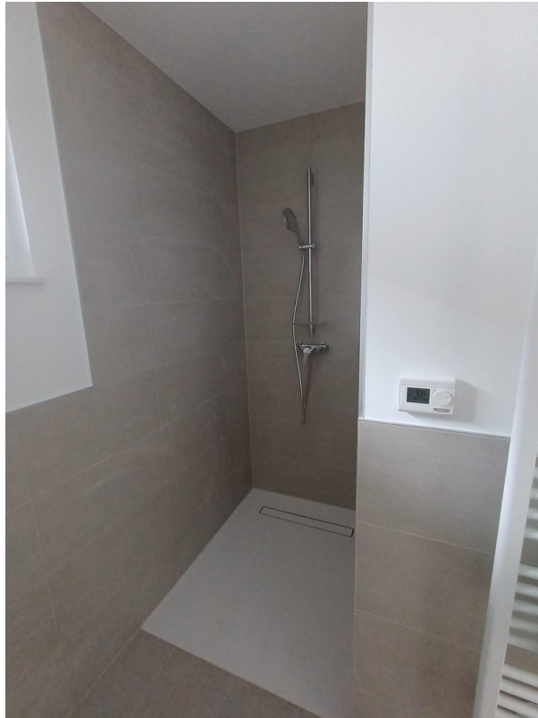
Bad 1 Walk-In-Dusche