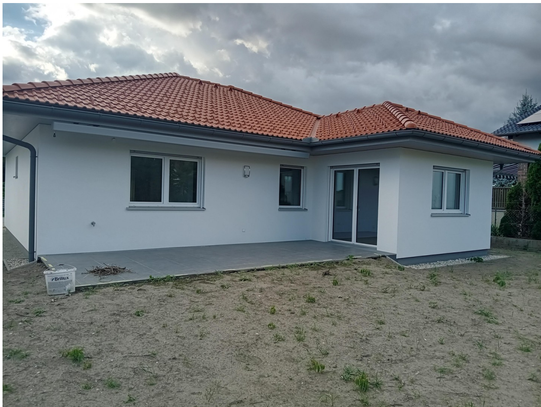
Hinteransicht mit Gartenteil