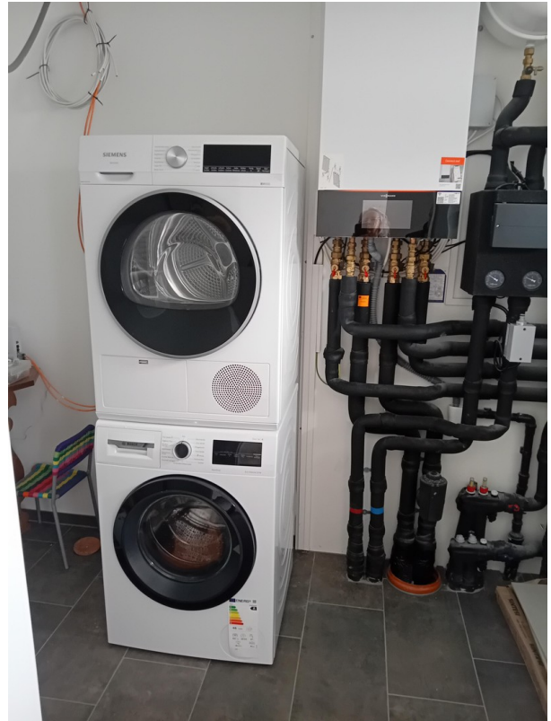
Technikraum mit WaMa&Trockner