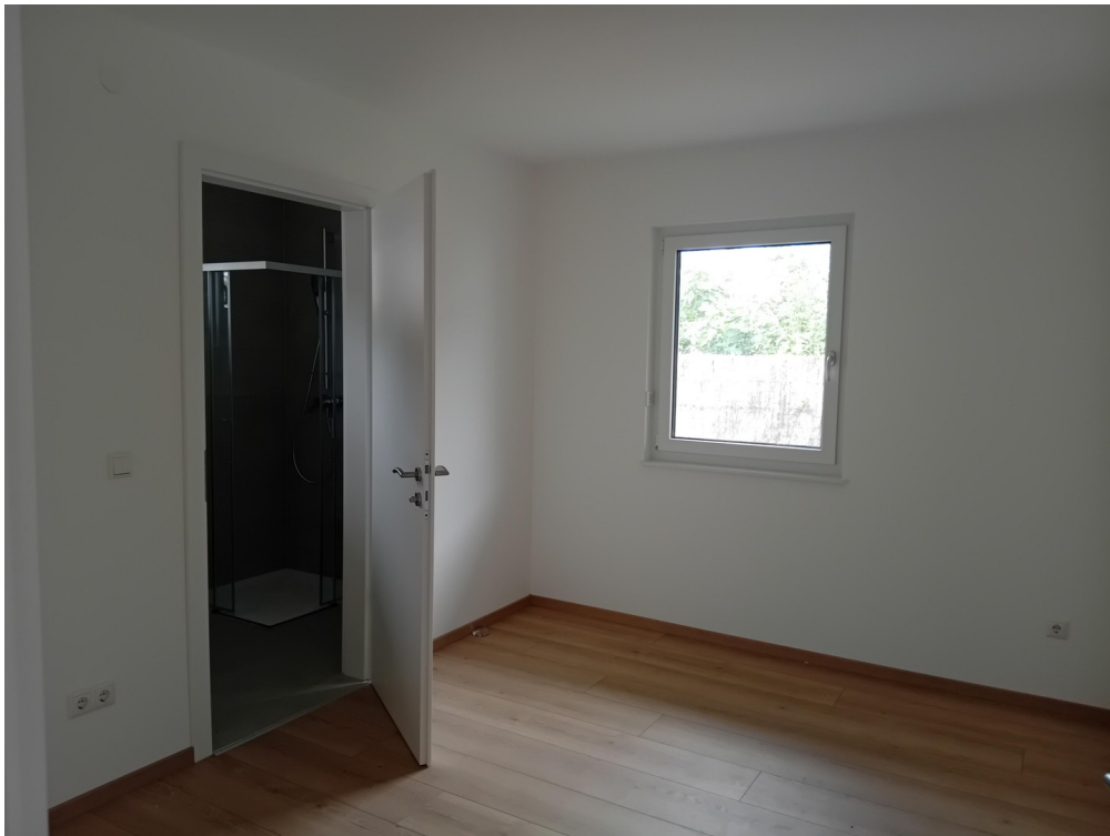
Zimmer 1 mit Bad