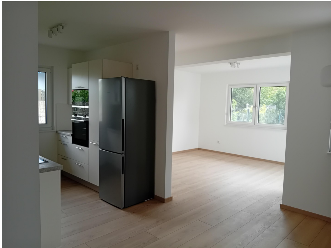
Küche mit Wohnzimmer