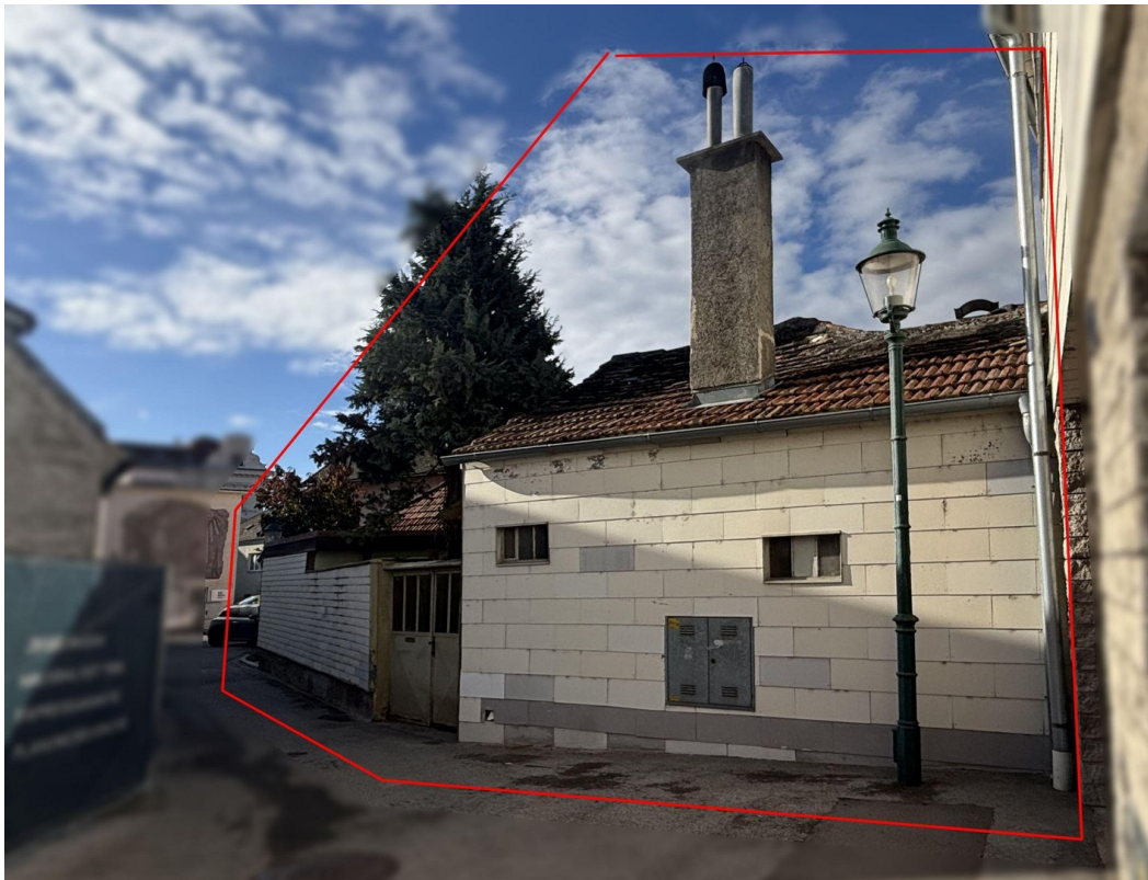
Ostansicht, Standort Pfannngass