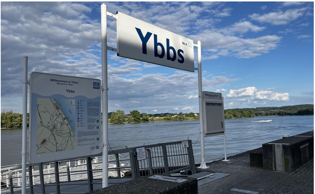
Donau 5 min Gehweg