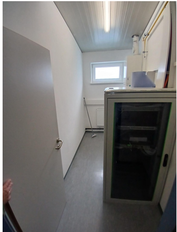
Technikraum / Archiv