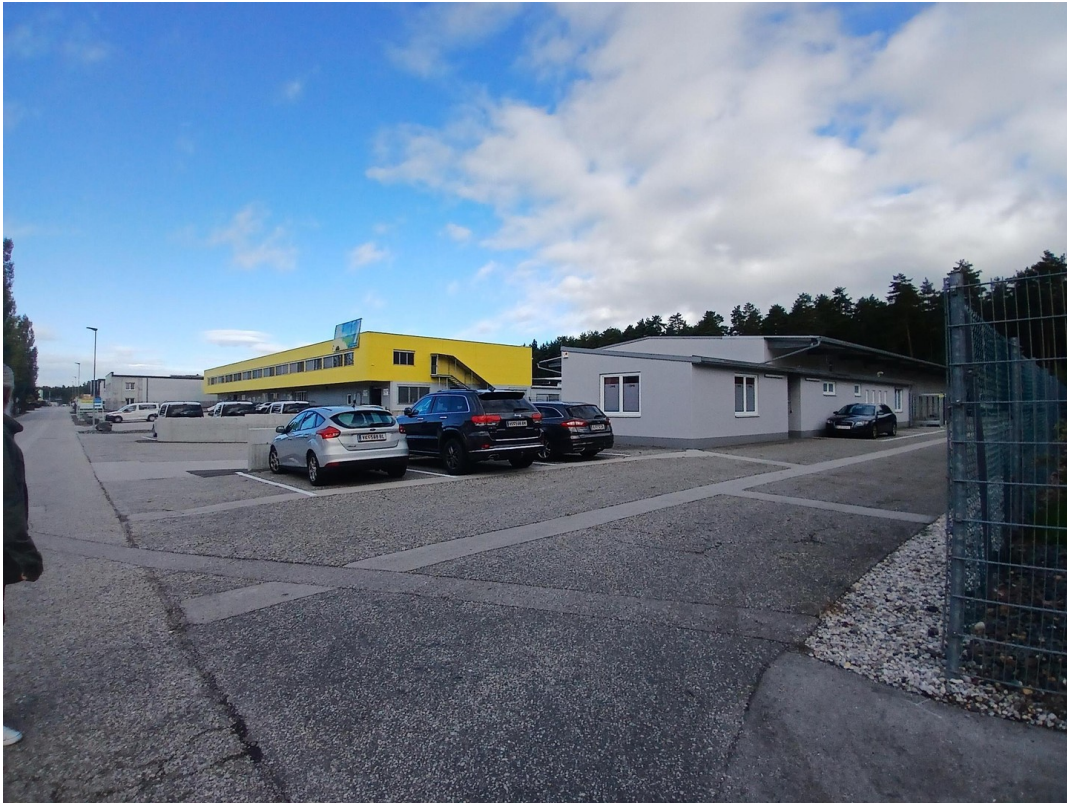
Außenansicht mit 4 Stellplätze