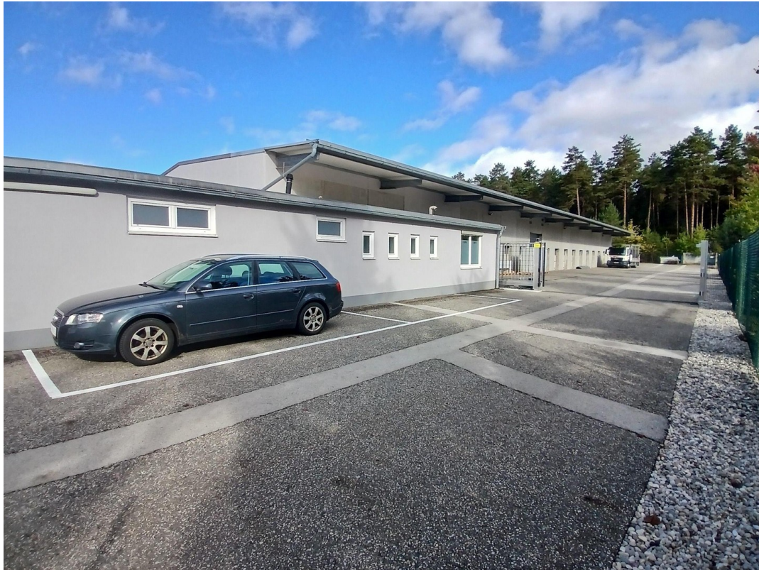
Außenansicht mit 2 Stellplätze