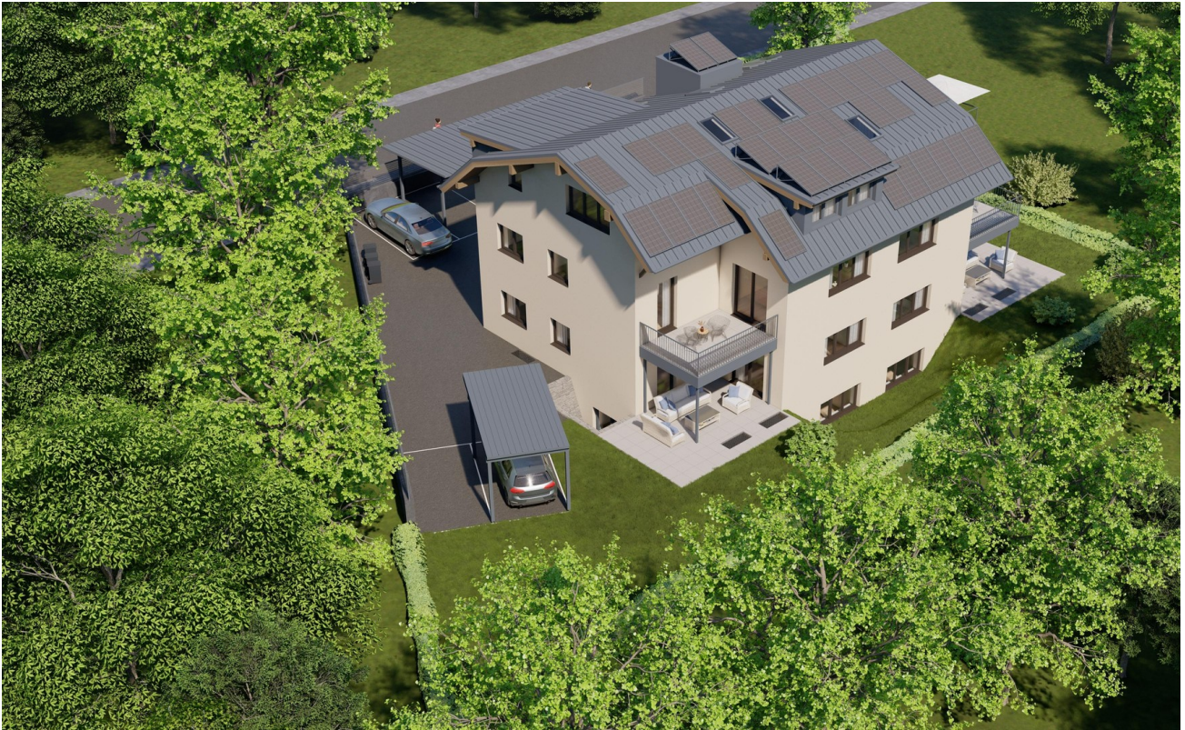
Ansicht Garten 2