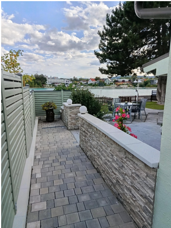
Eingangsbereich - Mittelweg