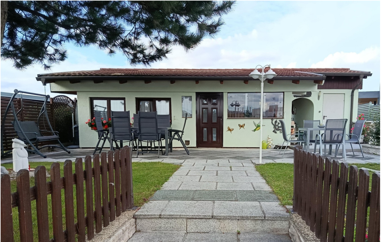
Blick Haus Obere Terrasse