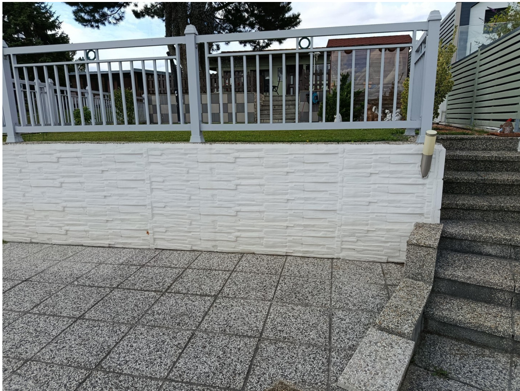
Stiegen zur Seeterrasse