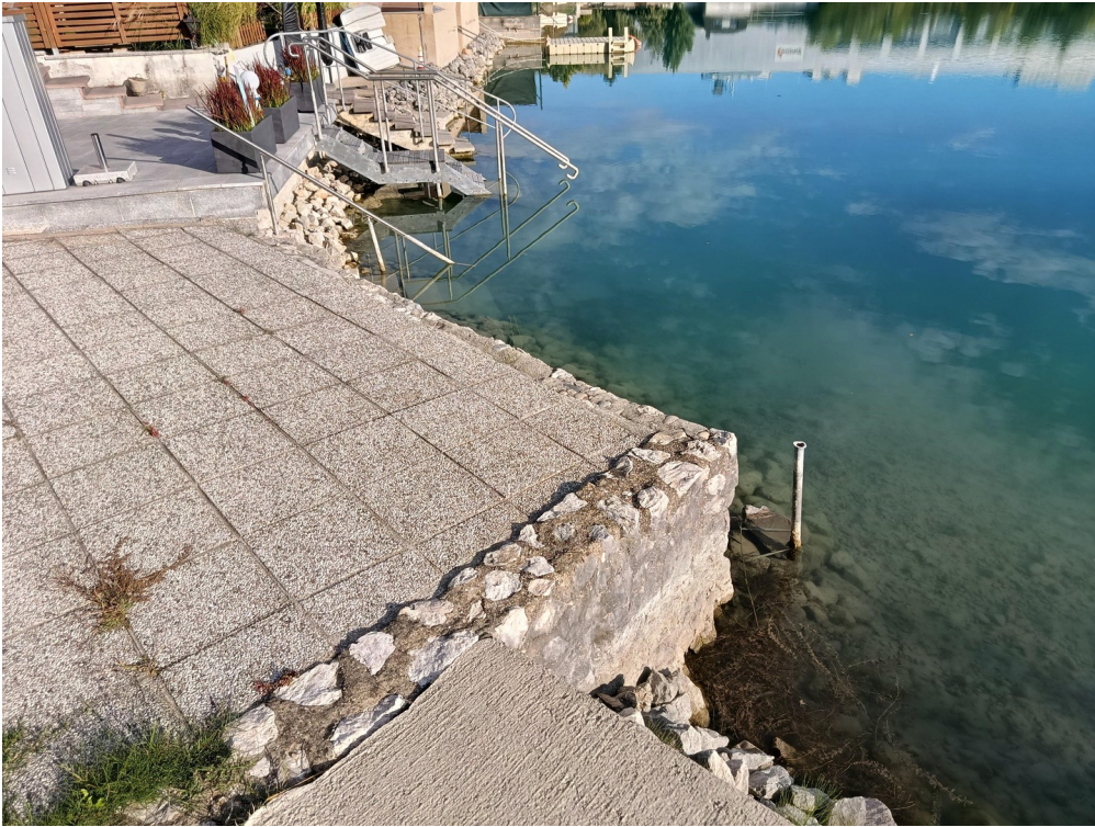
Liegefläche - See