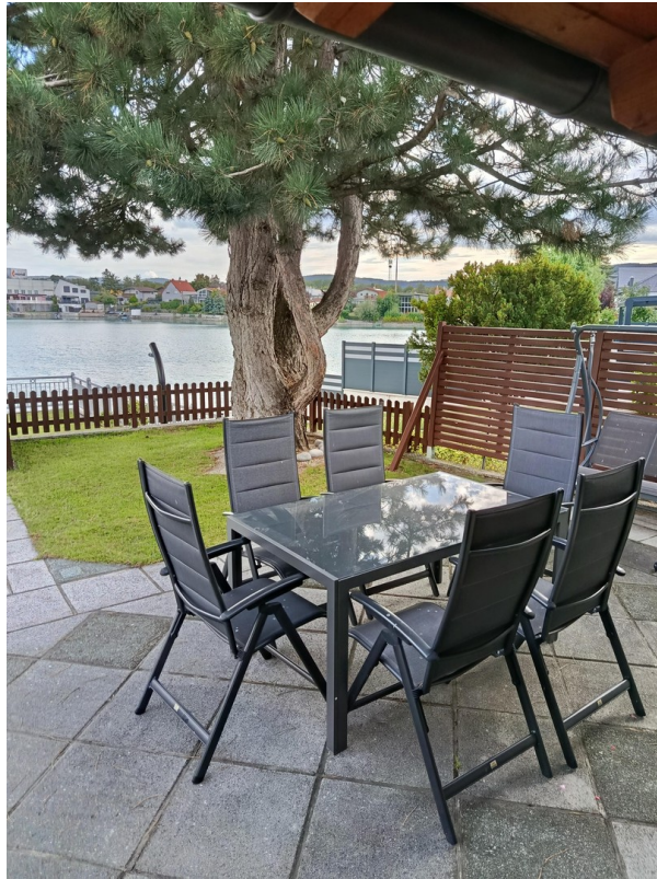
Obere Ebene - Terrasse