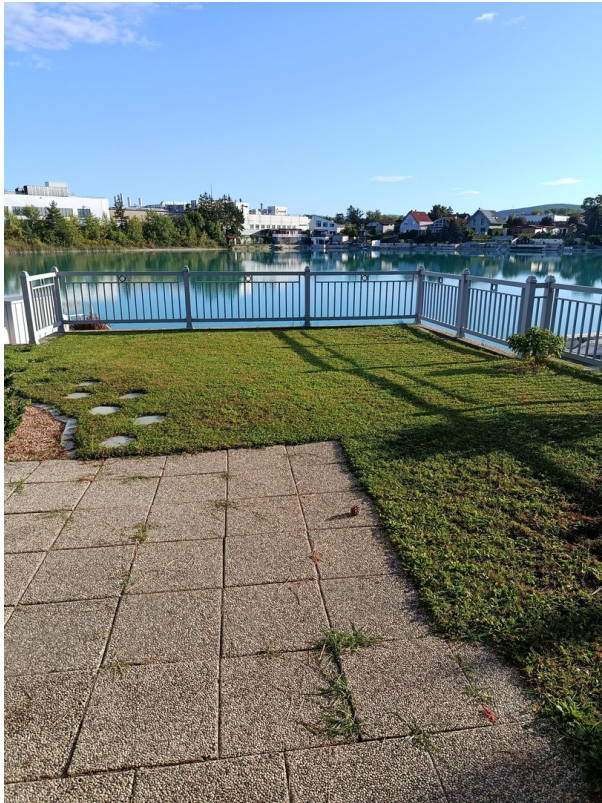
Mittlere Ebene Ri. See