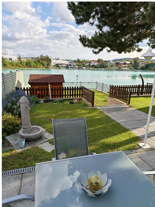
Obere Ebene - Blick am See