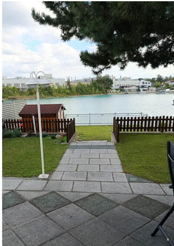
Obere Terrasse Blick am See