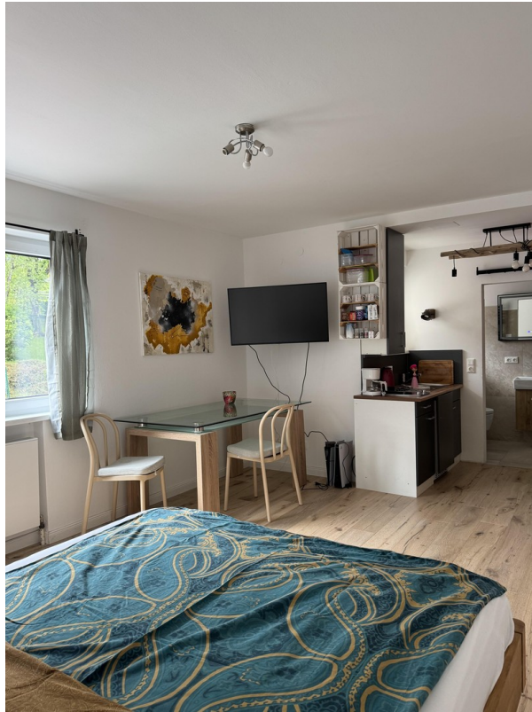
Essecke / TV