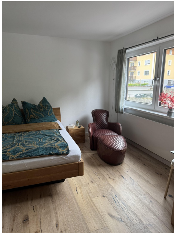
Relax from Tage