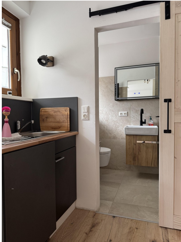
Küche / Bad