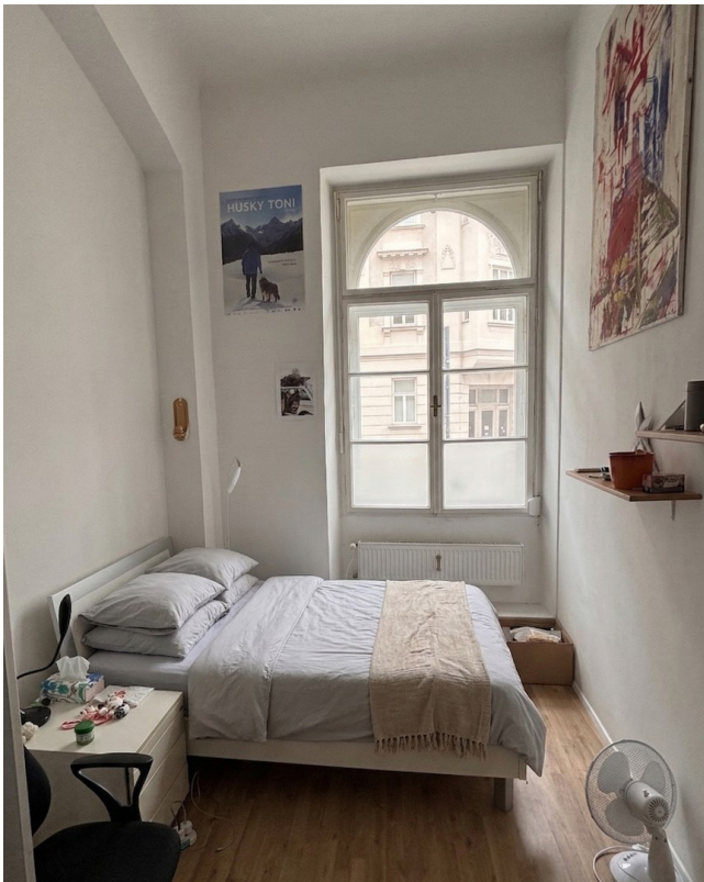
WG - Zimmer 2