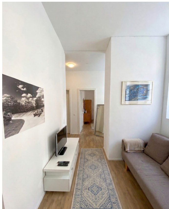
Wohn- / Esszimmer