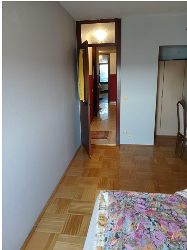
Schlafzimmer Bild 2