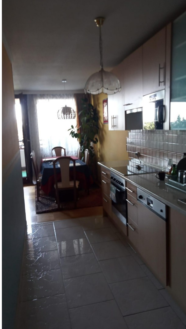
Küchenteil nr 2