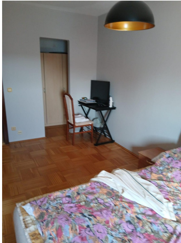
Schlafzimmer bild nr 3