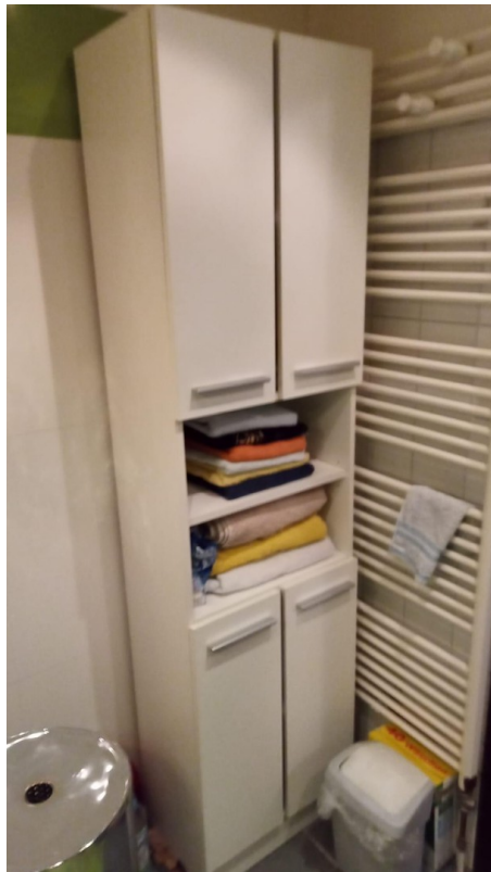
Kasten im Bad