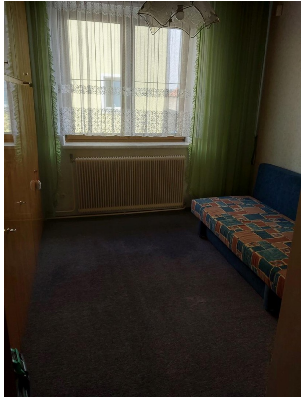
Schlafzimmer 2 EG