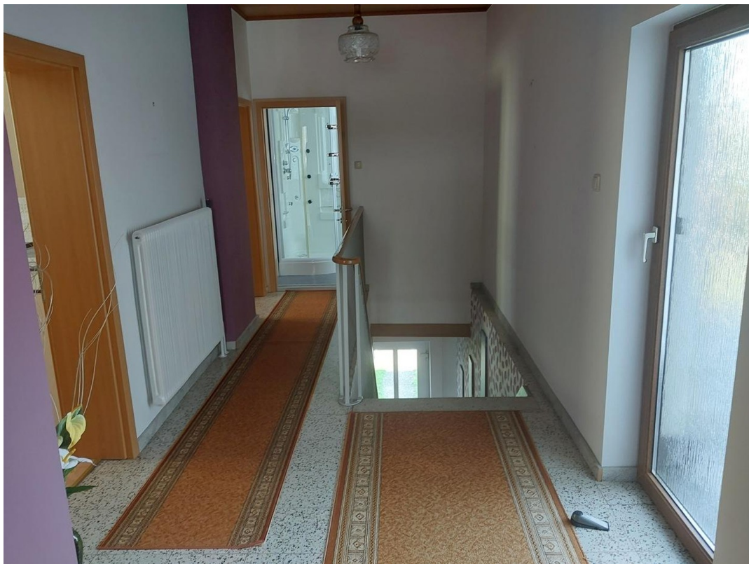
Gang OG (mit Balkontür)