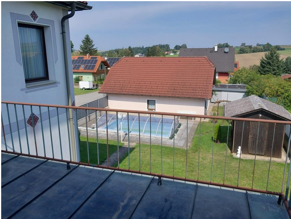
Balkon OG (Richtung Garten)