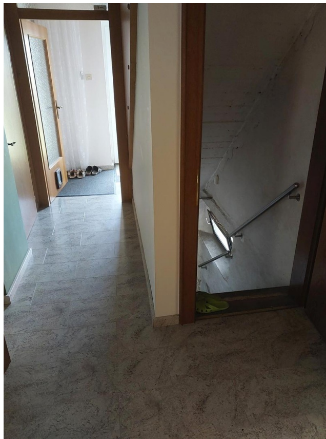
Gang EG mit Abgang Keller