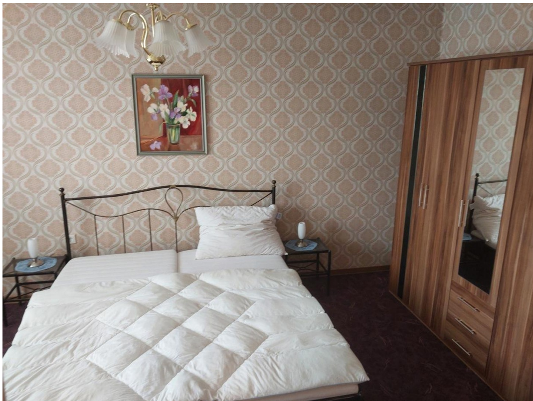
Schlafzimmer 4 OG