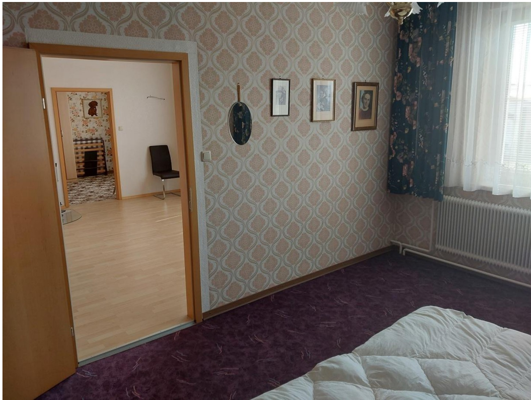
Schlafzimmer 4 OG