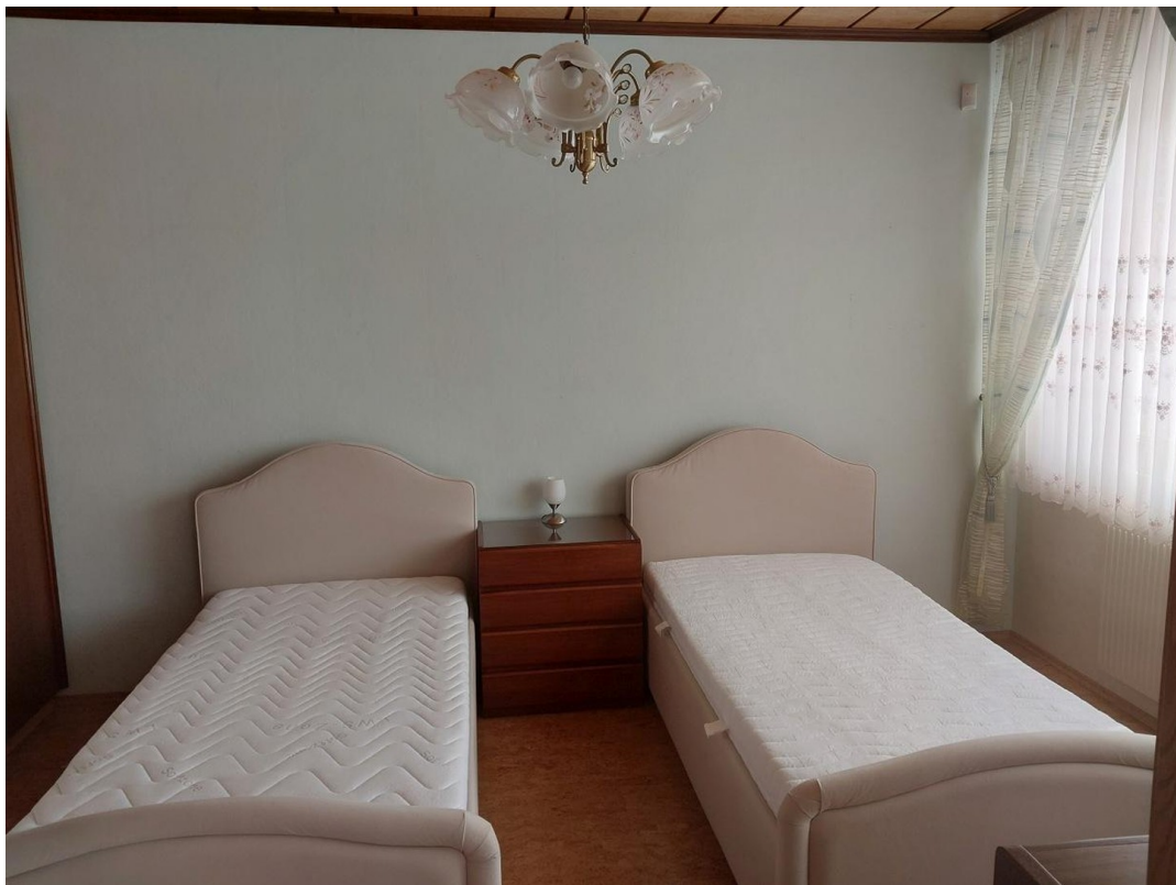
Schlafzimmer 1 EG