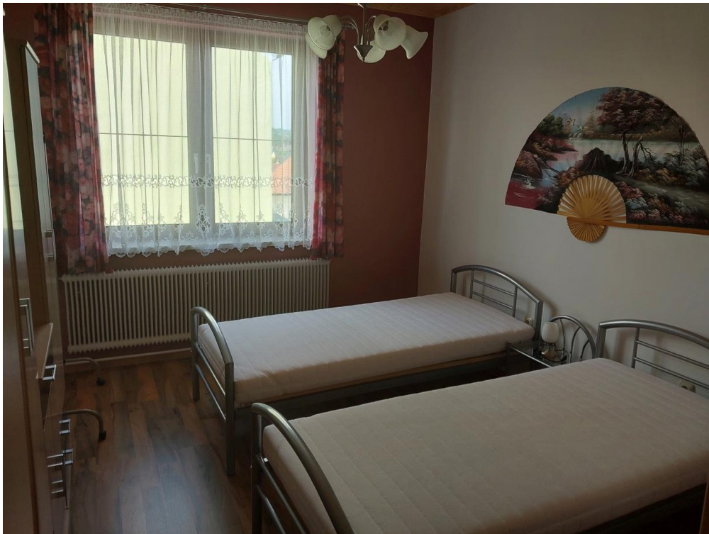
Schlafzimmer 3 OG