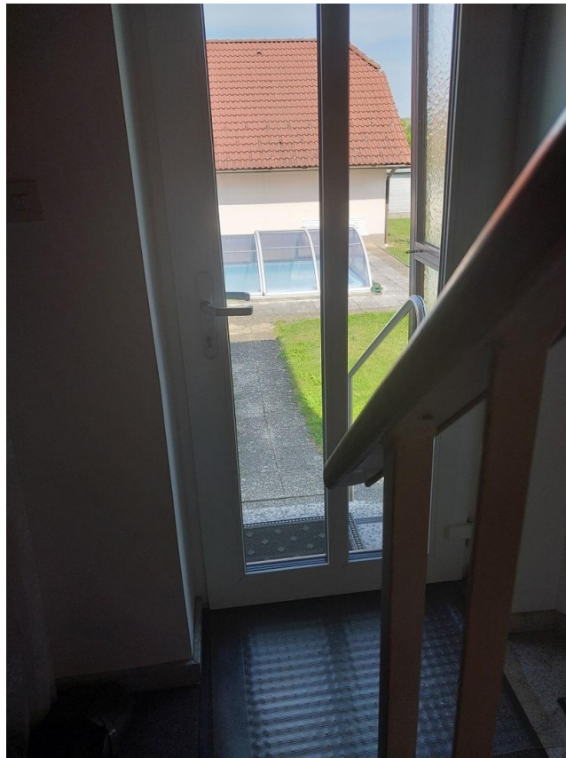
Ausgang in den Garten