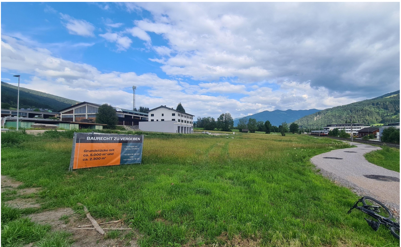
Blick Richtung Radstadt