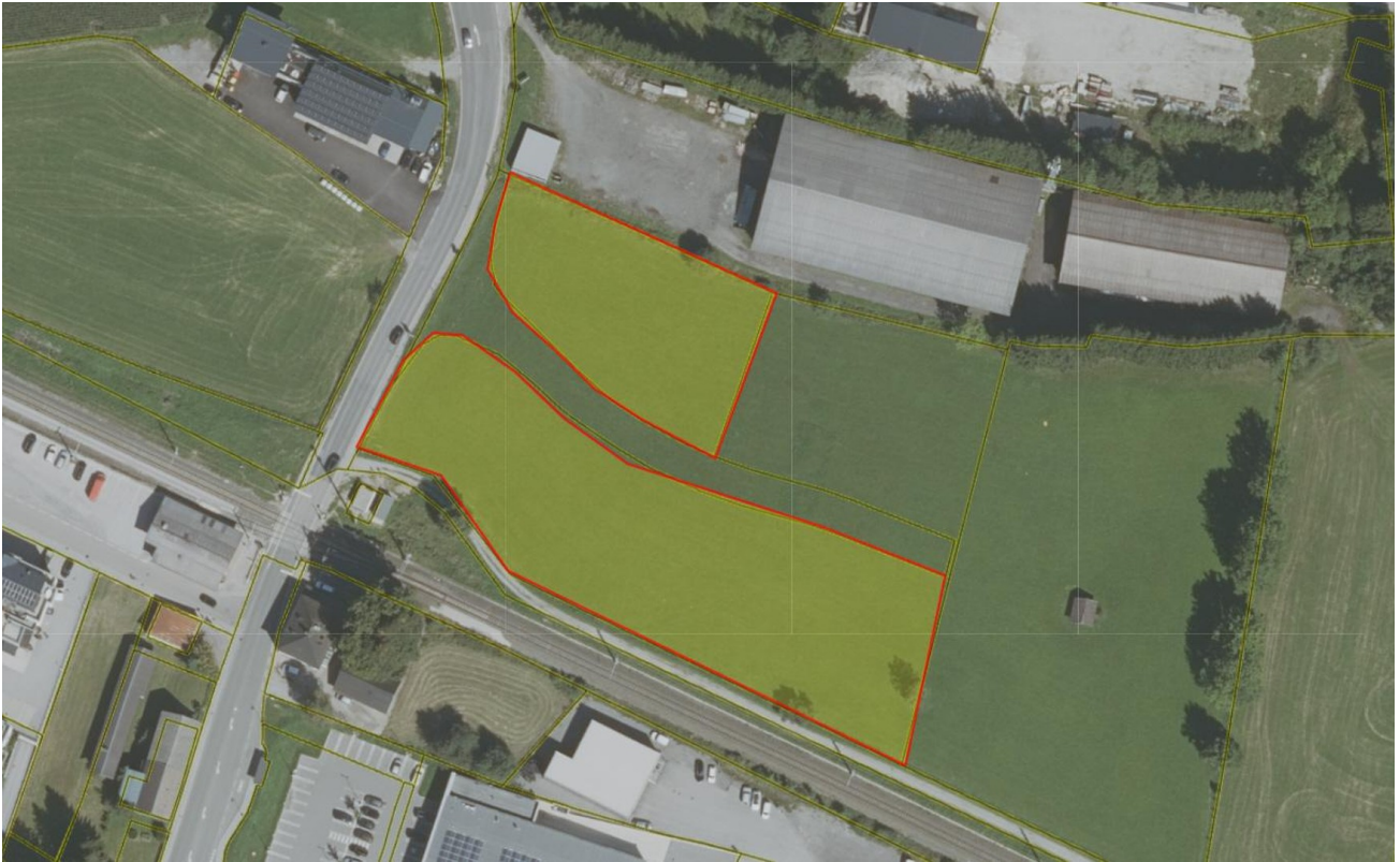
Ansicht 2.300 m 2 und 5.000 m 2