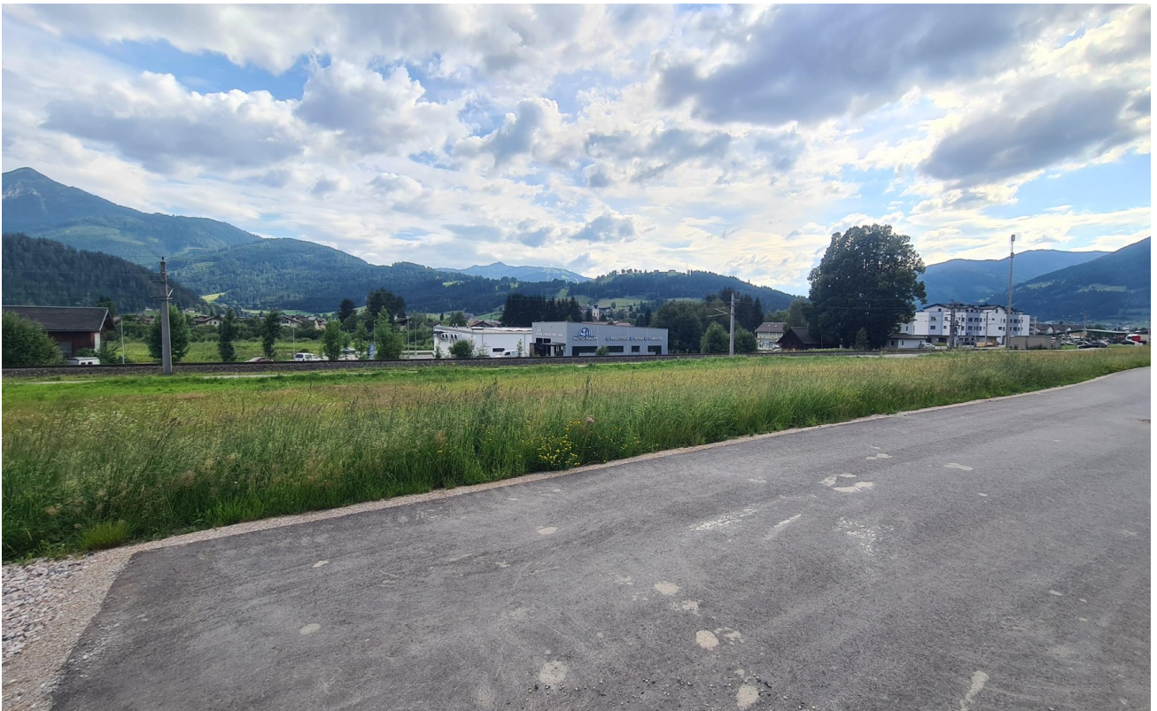
Blick Richtung Altenmarkt