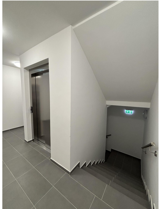
Aufzug & Stiegenhaus