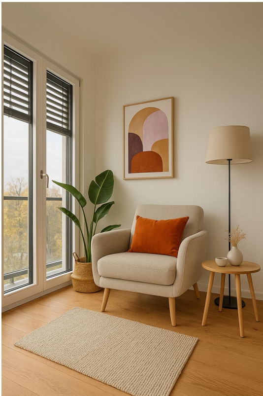
KI generiertes Home Staging