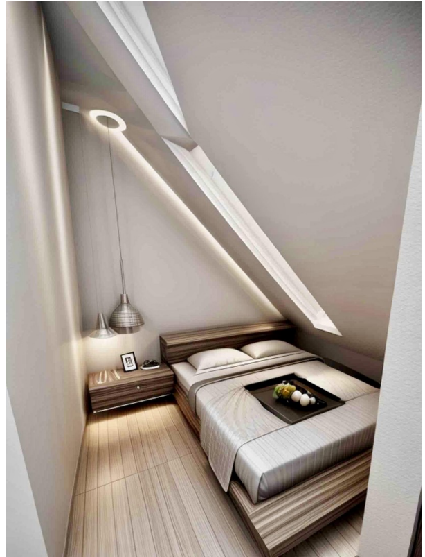
KI generiertes Home Staging