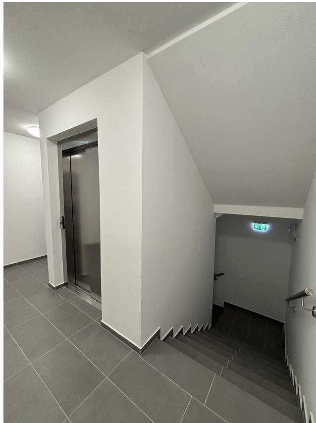
Aufzug & Stiegenhaus