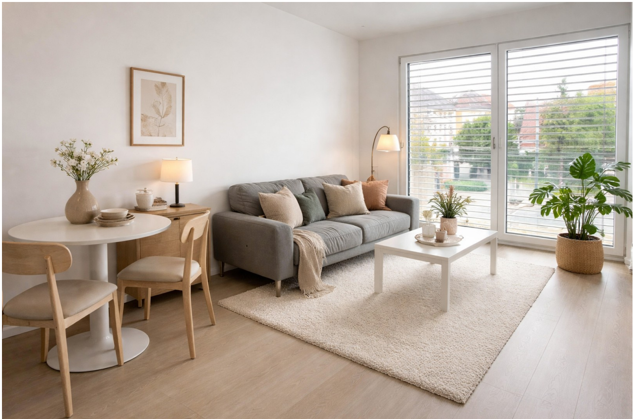
Wohnbereich - KI generiert