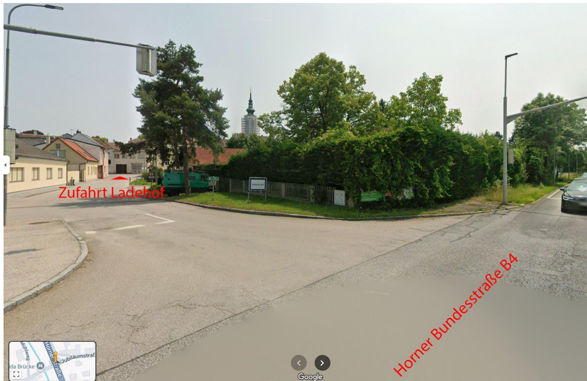
Zufahrt von B4