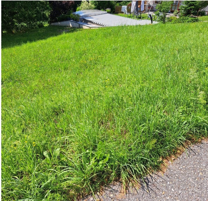
Blick zum Nachbarn