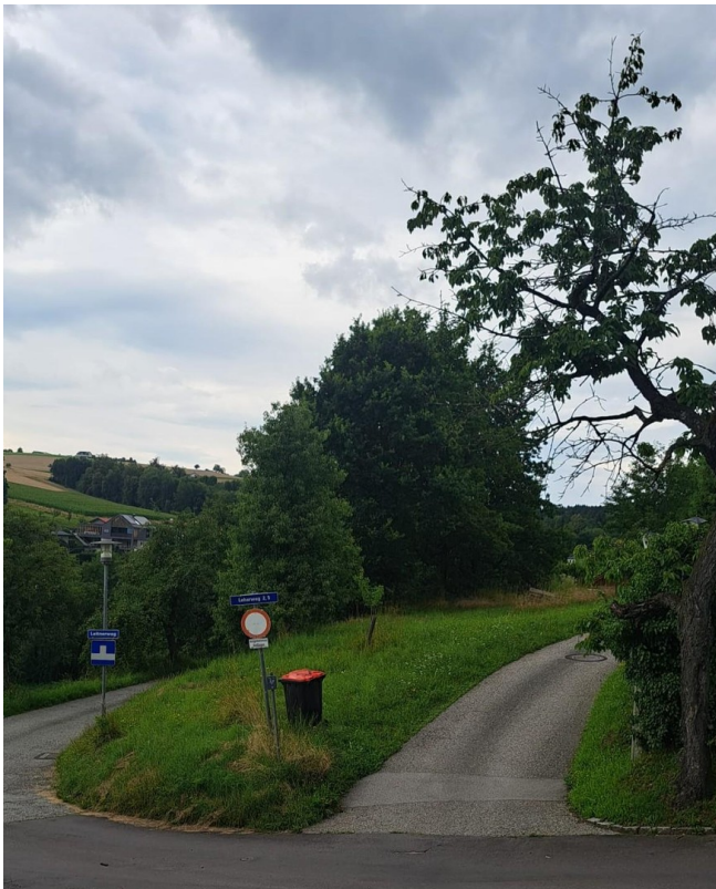
Grund liegt zw. 2 Straßen