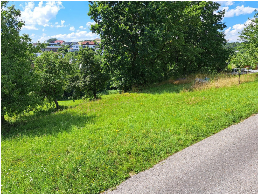
Zufahrt auch von oben möglich