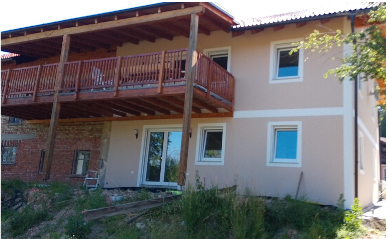
Terrasse 15 m 2