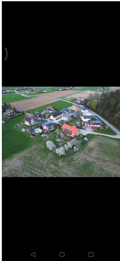
Das Haus mit dem Roten Dach vo