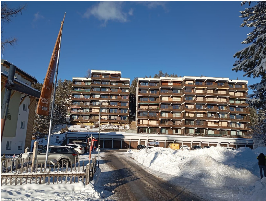
Ansicht Haus A u. B