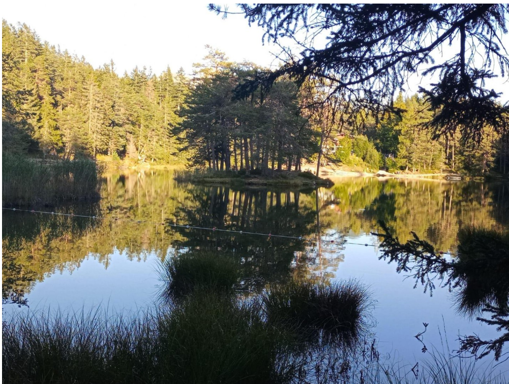
Insel im See