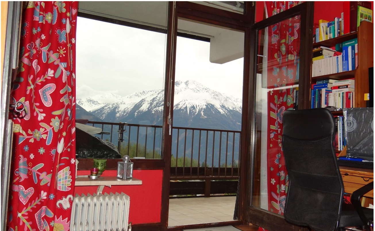
Ki-Zimmer Blick Hochdeder