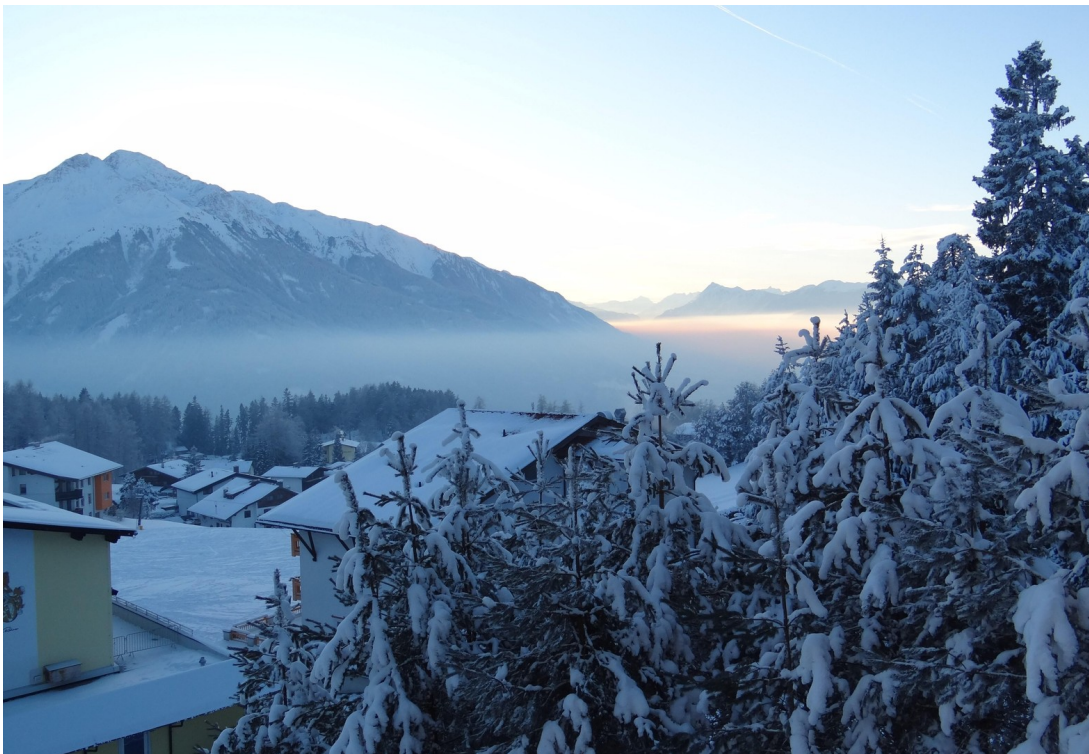
Blick ins Inntal