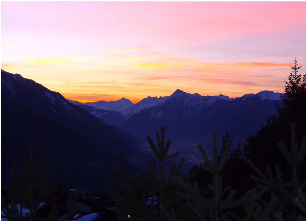
Blick ins Inntal am Abend