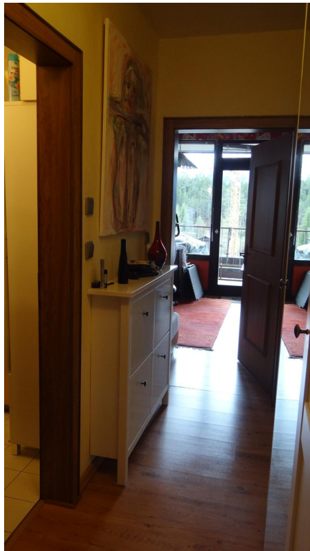
Blick vom Flur ins Ki.Zimmer