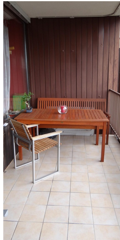
Balkon gemütliche Essecke