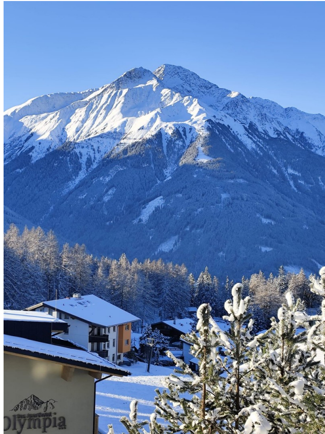
Blick auf den Hocheder