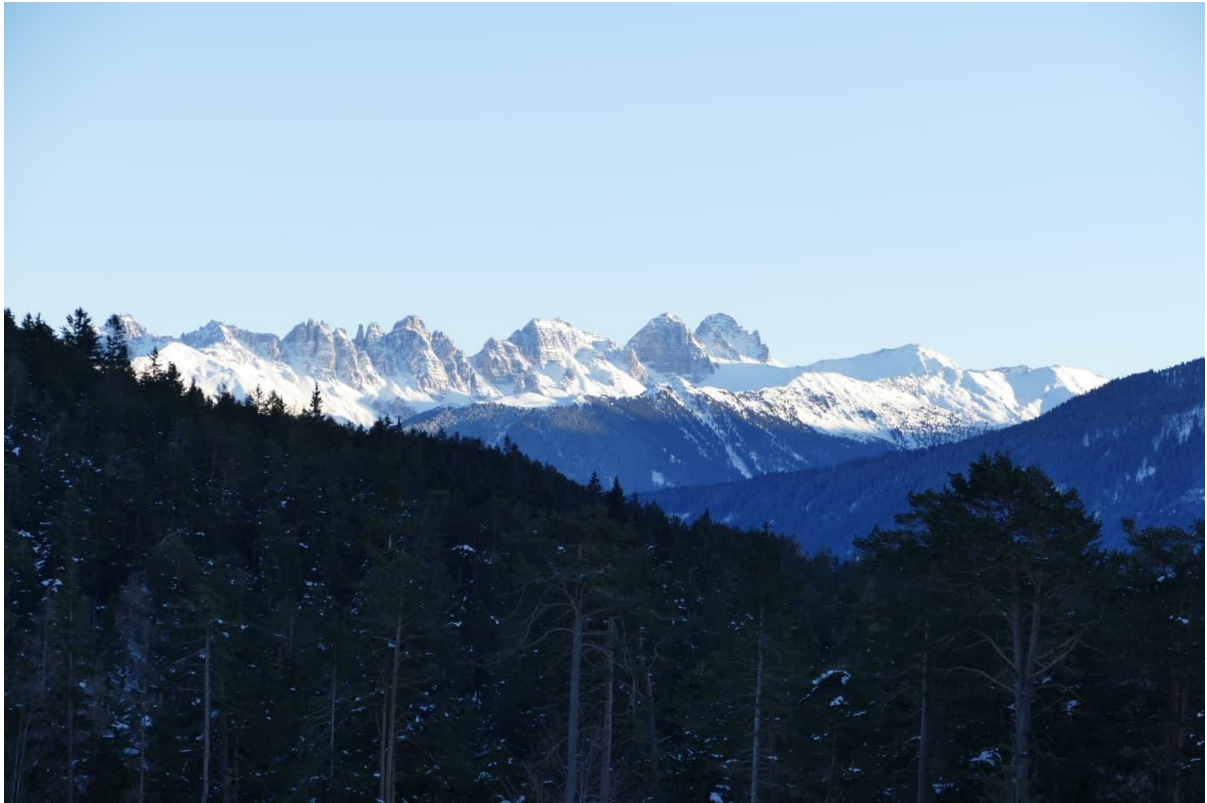
Blick auf die Kalkkögel