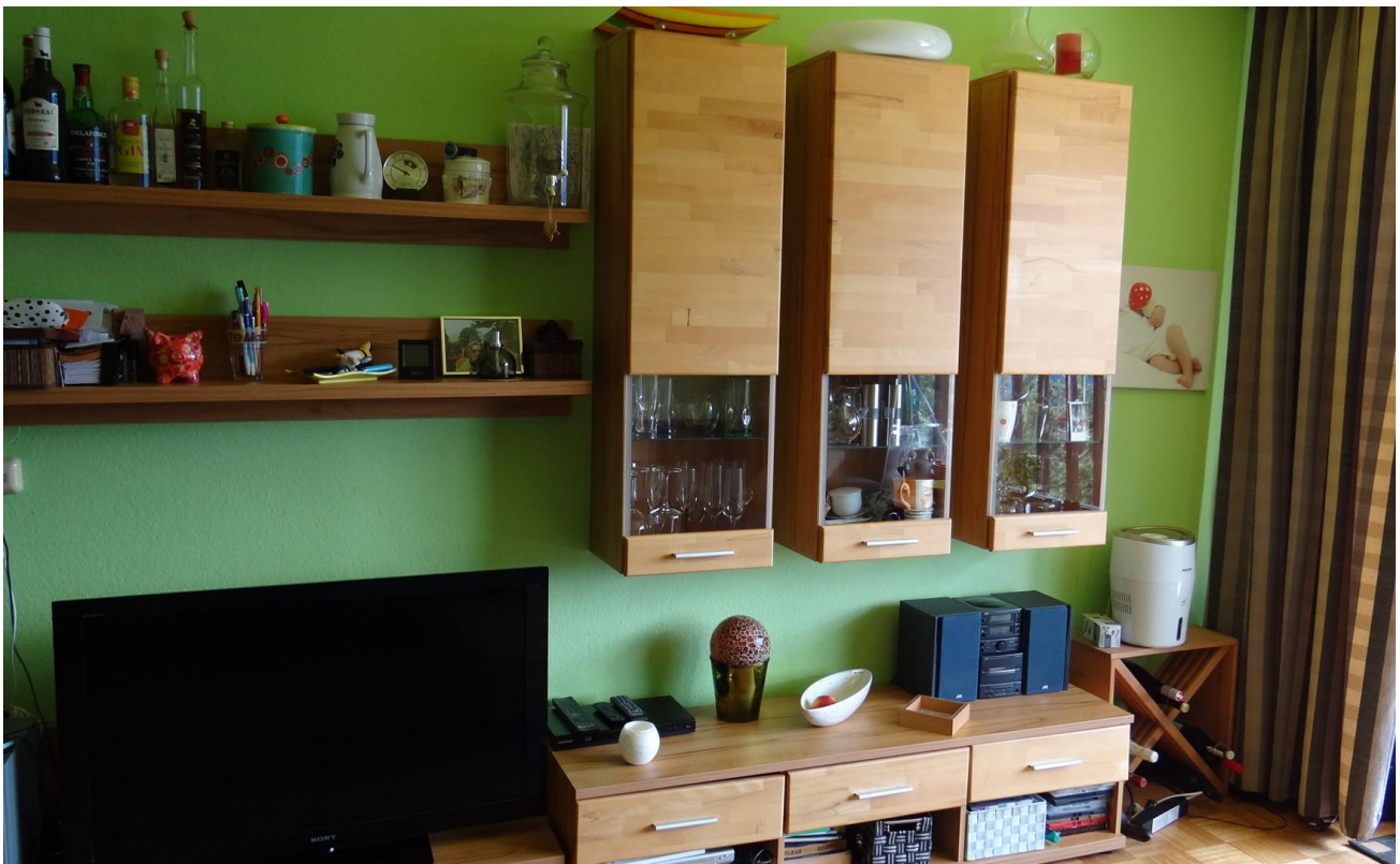
WZ gegenüber Sitzzecke