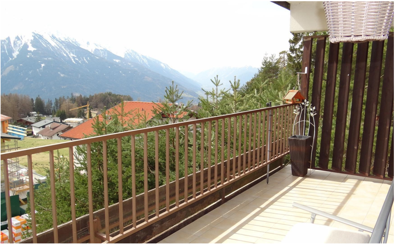
Balkon re. Seite