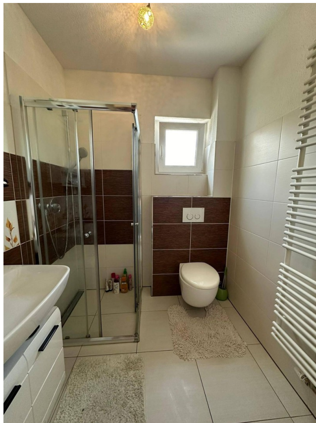
Dusche, WC im EG