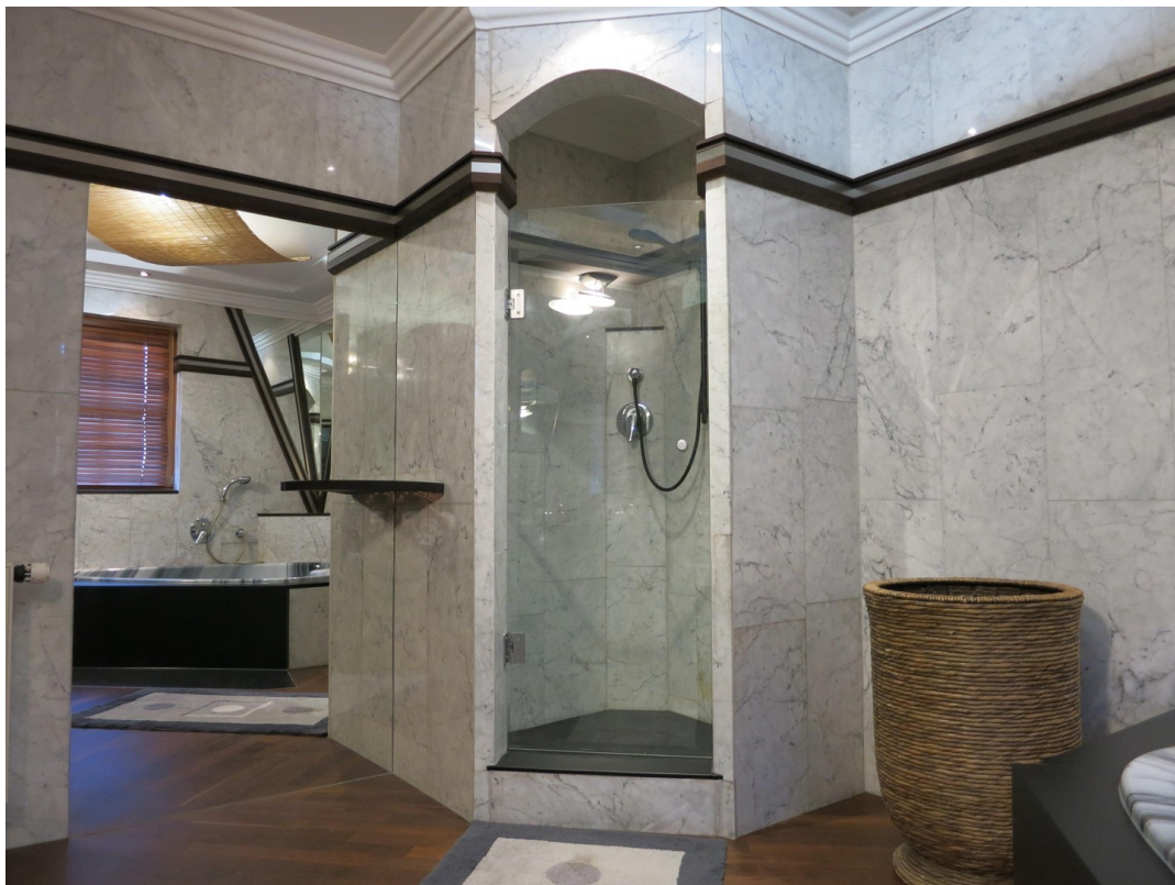
Dusche im Badezimmer