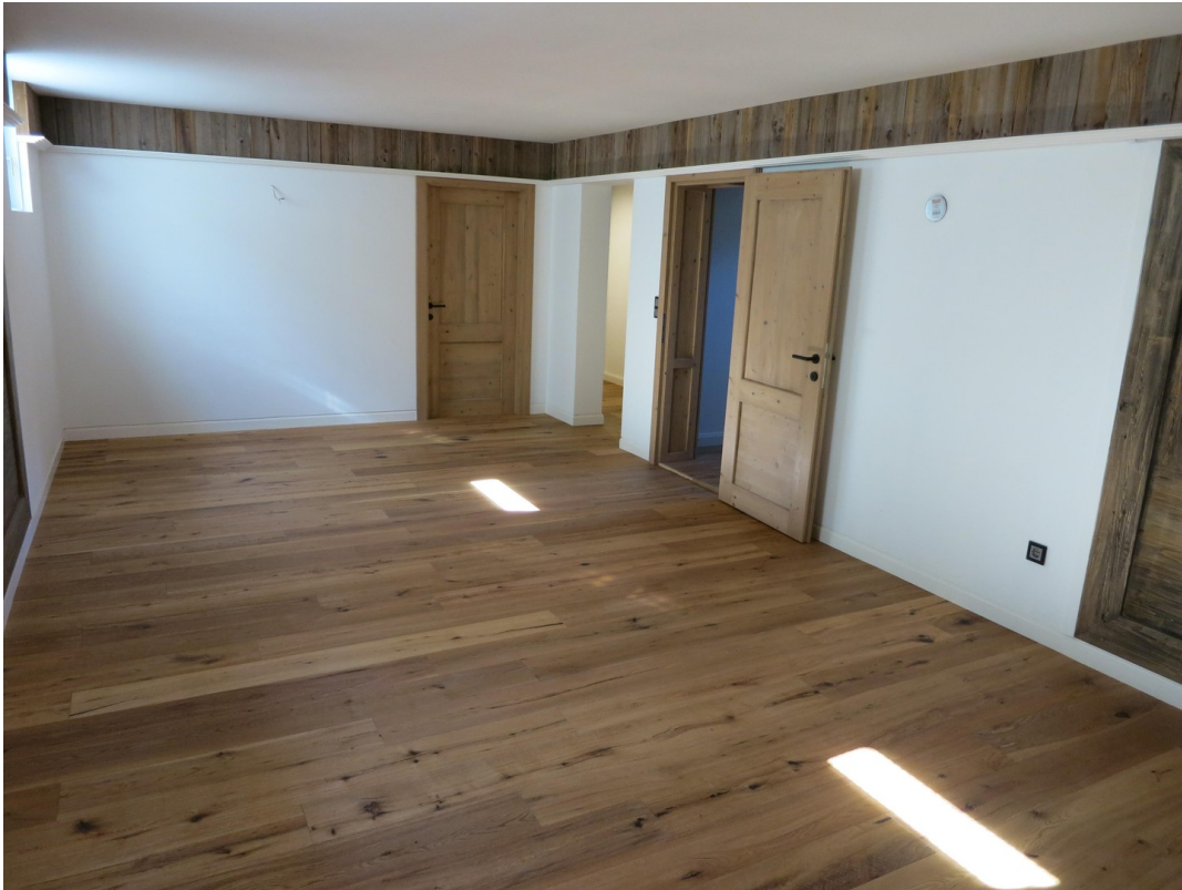
Großer Raum UG