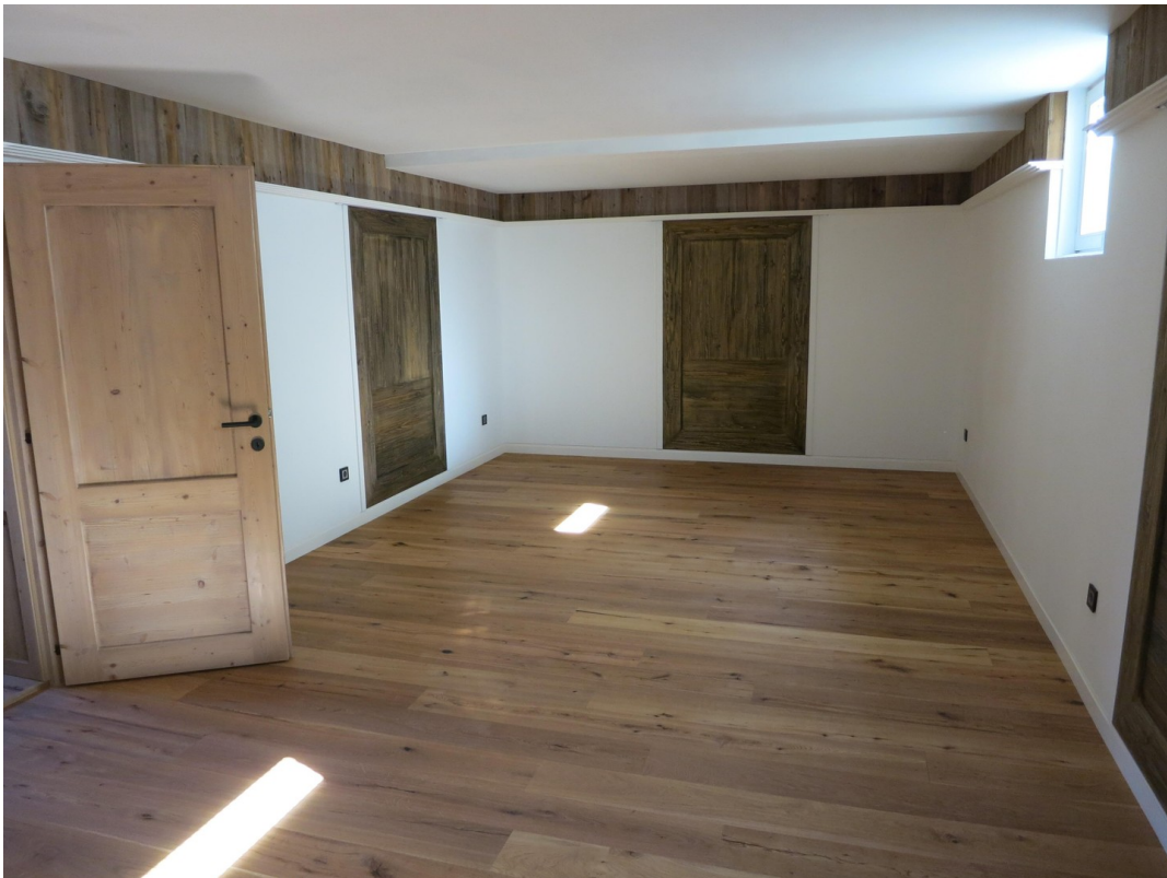
Großer Raum UG