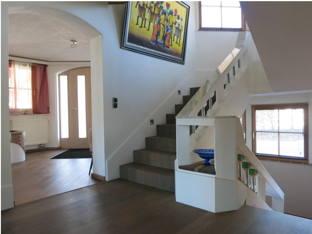
Stiegenhaus und Diele EG