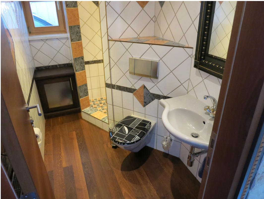
WC mit Dusche EG