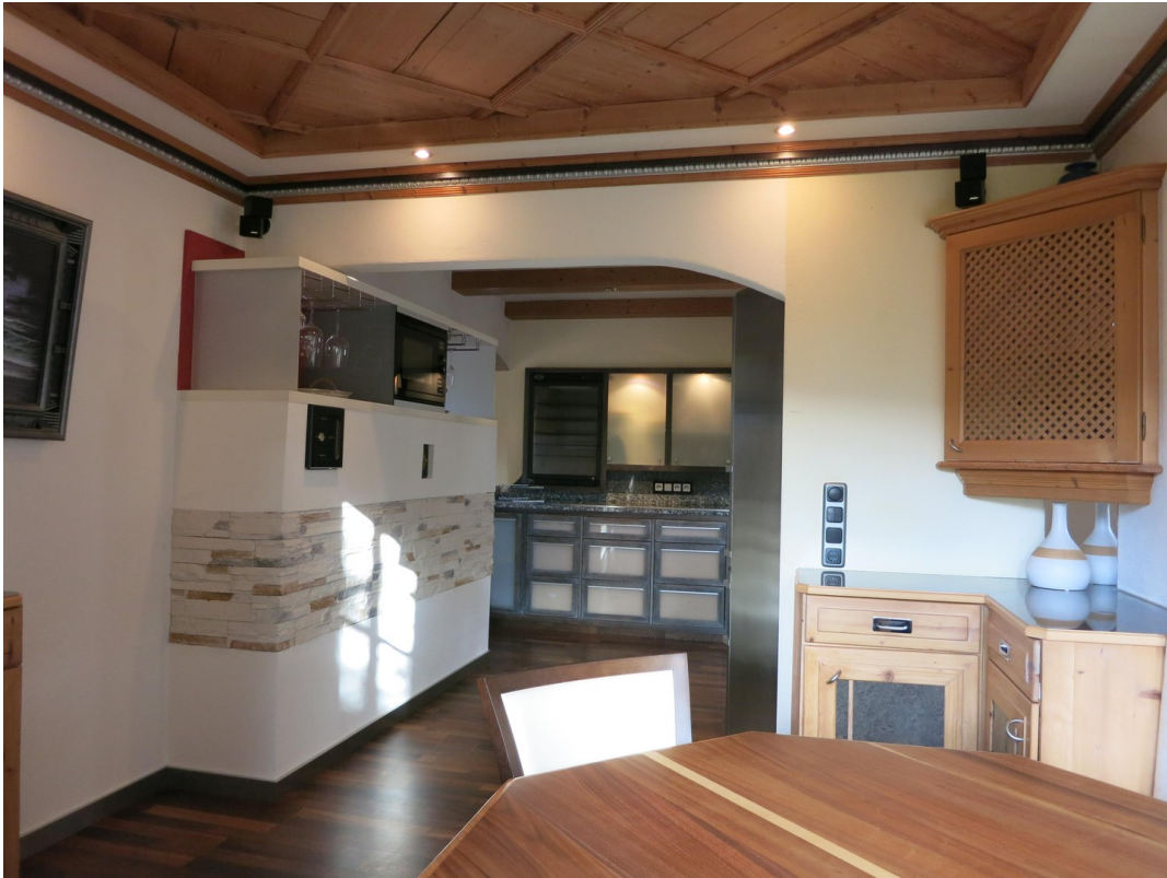
Esszimmer mit Küche