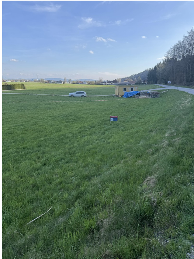
Blick Richtung Süden