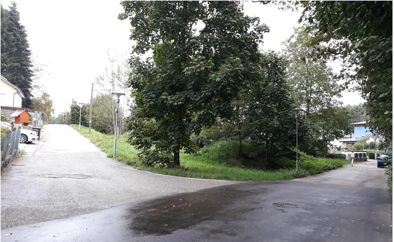
Zufahrt an 2 Seiten gegeben