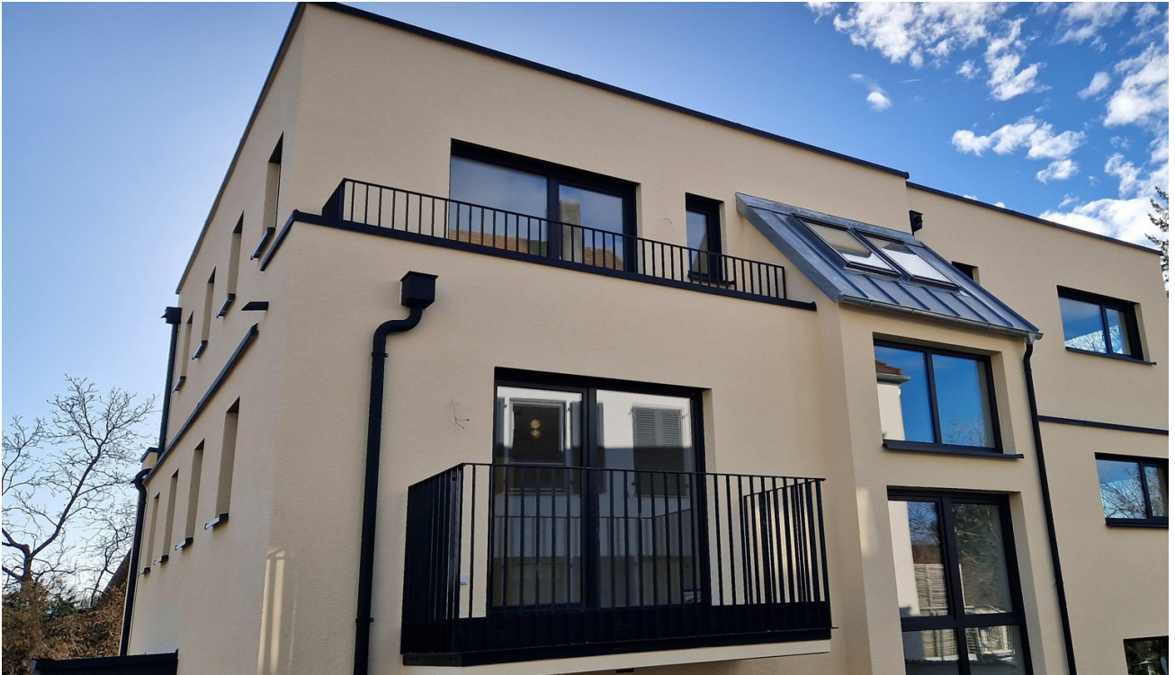
Haus von oben rechts