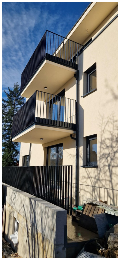
Haus von oben links