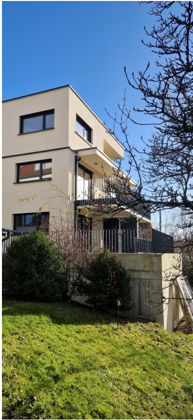
Galgenberg Panorama von unten