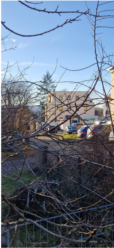
Gesamtobjekt von oben