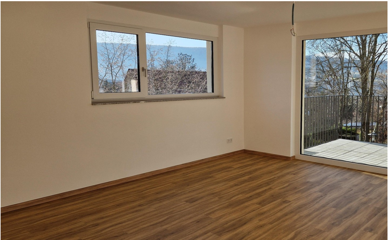
Blick nach außen