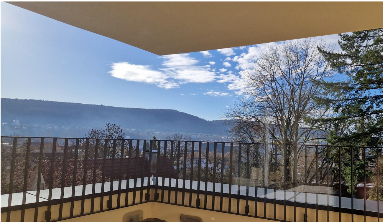
Blick Richtung Langert