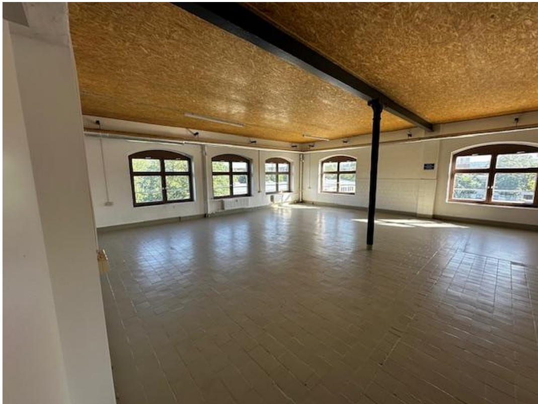
Büro oder Lager