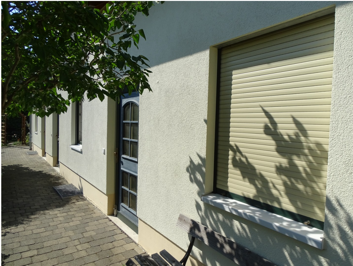
WG Eingang ebenerdig