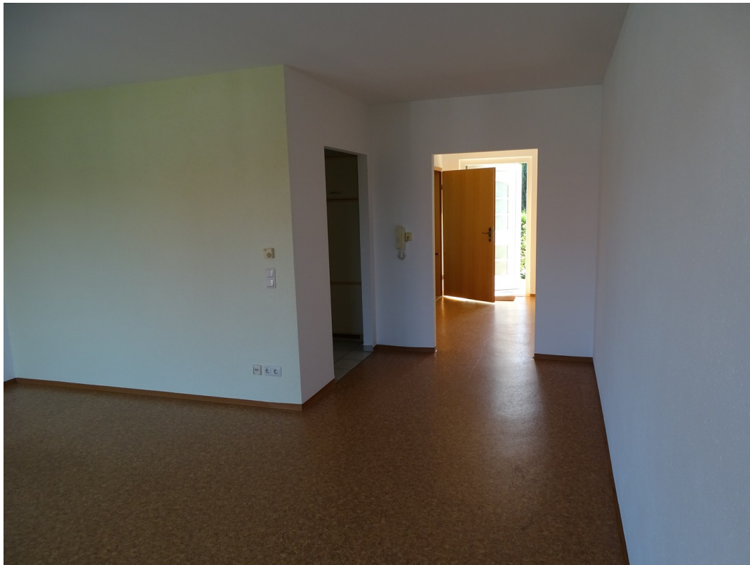
Aus Richtung Balkon/Eingang