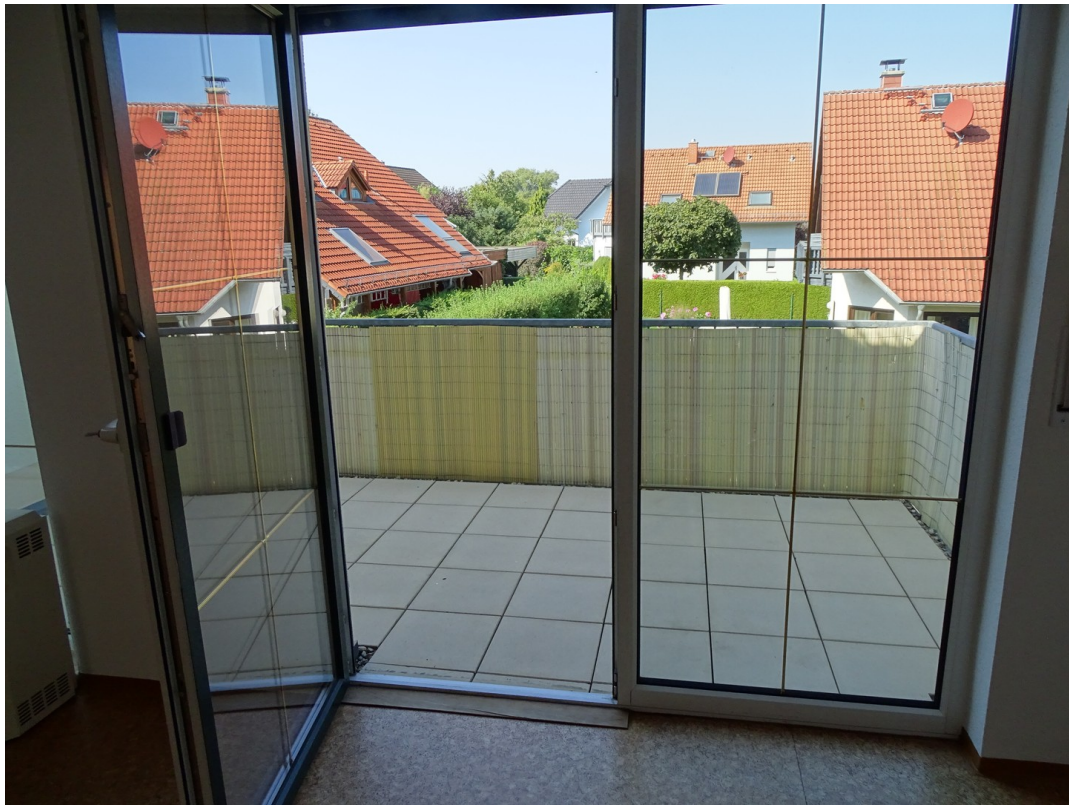
Blick nach Nord/West